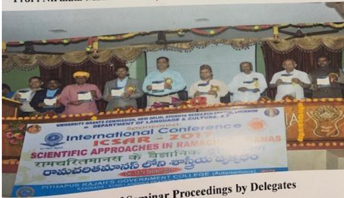
Handover of Seminar Proceedings by Delegates