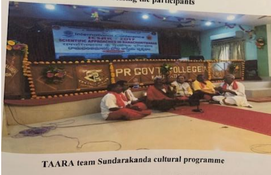
TAARA team Sundarakanda cultural programme

At 5pm conducted Cultural Programme “Sunadarakanda” by Telangana All Arts Research Association , Hyderabad up to 7pm