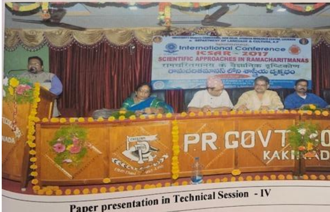
Paper presentation in Technical Session - IV